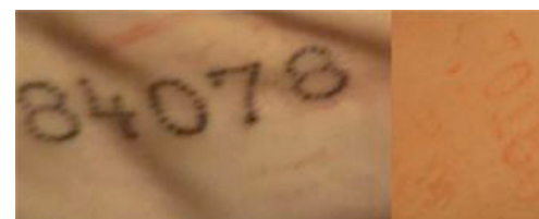
РИС. 1 Пример хорошей и плохой татуировки