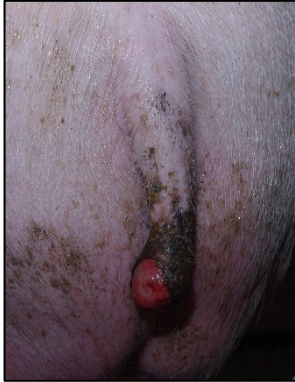
Alvorsgrad 2 - halekuperede haler

Alvorsgrad 2 - alvorlige haleskader. Halen er varm og hævet og der er tegn på infektion.